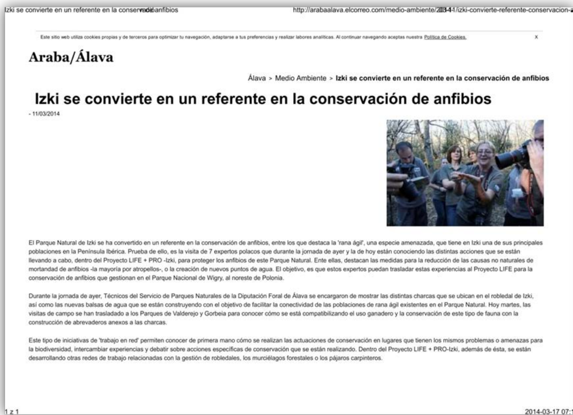
Fot. 1. Wzmianka w prasie lokalnej o wizycie specjalistów z Polski

W okresie sprawozdawczym odbyło się kilka spotkań z przedstawicielami innych projektów realizowanych z programu LIFE. W dniach 8-15 marca 2014 roku odbyła się pierwsza, z pięciu zaplanowanych w projekcie, wizyta zagraniczna. W wyjeździe do Hiszpanii uczestniczyły 4 osoby, które odwiedziły miejsca realizacji dwóch projektów finansowanych przez UE w ramach LIFE. Nawiązano kontakty z projektem „PRO-Izki - Ecosystem Management of Izki Quercus pyrenaika forest and habitats and species of community interest related to it.” realizowanym na terenie Parku Krajobrazowego IZKI w Kraju Basków. W Katalonii zapoznano się z realizacją projektu „PROYECTO ESTANY – Improvement of the Natura 2000 habitats and species found In Banyoles: a demonstration project”. Wyjazd był okazją do wymiany doświadczeń oraz nawiązania bliższych kontaktów między specjalistami, co zostało odnotowane w lokalnej prasie (Fot. 1). Sprawozdanie z wyjazdu stanowi Załącznik nr 7 do Raportu.